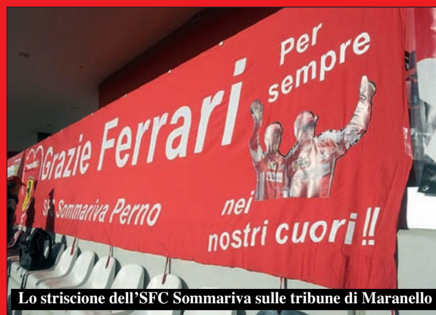
Lo striscione dell'SFC Sommariva sulle tribune di Maranello

Erano in 50 mila domenica 8 Novembre all'Autodromo del Mugello per il salutare il mito "FERRARI". Fra questi c'era anche lo SFC Sommariva Perno con un centinaio di tesserati provenienti da tutta la provincia. In una splendida giornata di sole, con una tribuna gremita e rivestita di bandiere del Cavallino e striscioni di ogni foggia, si è dato appuntamento tutto il mondo Ferrari per l'ultimo atto della stagione, le Finali Mondiali Challenge, dalle 458 Evo GT alle Formula Uno Clienti al programma FXX con le loro Ferrari Storiche. Il clou della giornata è stato indub-