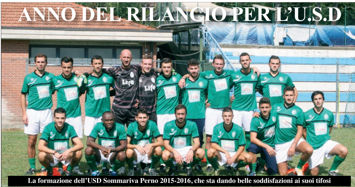
La formazione dell'USD Sommariva Perno 2015-2016, che sta dando belle soddisfazioni ai suoi tifosi

Siamo ormai al giro di boa dei vari campionati ai quali sono iscritte le squadre del USD SOMMARIVA PERNO ed è quindi tempo dei primi bilanci. La prima squadra, inserita nel girone F del campionato di Prima categoria, sta ottenendo risultati lusinghieri; è infatti sempre stata nelle prime sei posizioni della classifica, per intenderci quelle che danno diritto a giocare i Playoff per il pas-