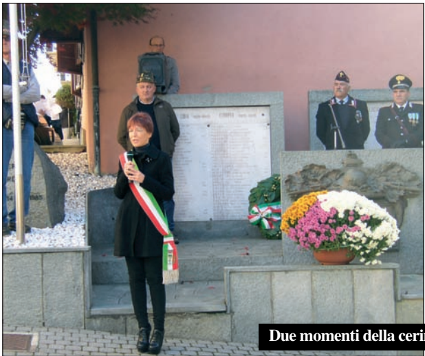
Due momenti della cerimonia del IV Novembre