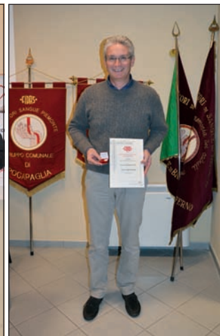
la richiesta di oggi. Occorre ricordare che sia la donazione di plasma sia quella

simbolo del donatore "completo", perché è disponibile per donazioni di sangue intero, di plasma e di piastrine e rappresenta l'eccellenza nei nuovi canoni della donazio-