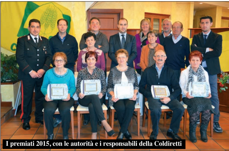
I premiati 2015, con le autorità e i responsabili della Coldiretti

Come da tradizione più che quarantennale, domenica 15 novembre i coltivatori hanno celebrato la loro annuale "Festa del Ringraziamento". Sempre semplice e bella, ha avuto un suo primo momento solenne nella S. Messa, con la benedizione dei frutti della terra da parte di don Gianni, che ha avuto parole di grande apprezzamento e di incoraggiamento per il lavoro dei coltivatori, i quali continuano a fornire "il pane" (e non solo) in un momento di così grave crisi che