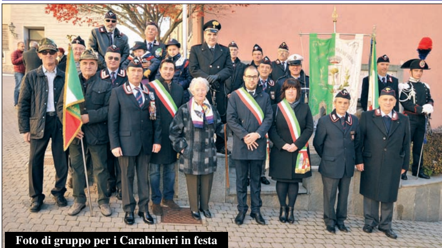
Foto di gruppo per i Carabinieri in festa