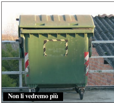
Non li vedremo più

Innanzitutto, a partire da gennaio 2016, il servizio di raccolta dei Rifiuti Solidi Urbani (RSU), nelle zone sud del paese verso Bra (a partire quindi da Arietti, Rivoira, Val Gai e fino a tutta la Frazione Rossi), sarà fatto PORTA A PORTA e non più con i cassonetti verdi che saranno rimossi. Tutti gli utenti dovranno quindi esporre i sacchetti neri nelle prime ore del mercoledì e del sabato, come avviene da sempre per il resto del territorio comunale. Sempre a partire da gennaio 2016 cambia l'orario del servizio raccolta differenziata della PLASTICA, con il passaggio dei mezzi per la raccolta dalle ore 12 alle 18 del mercoledì (anziché dalle 6 alle 12 attuali),